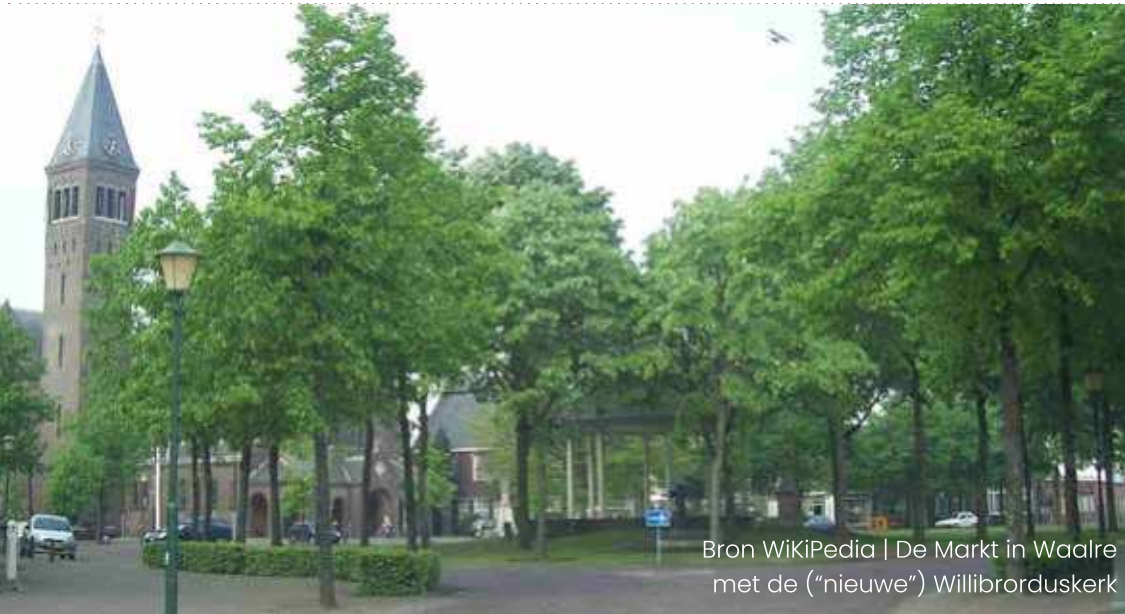
De Markt in Waalre met de ("nieuwe") Willibrorduskerk

Door deze strategieën toe te passen, kunt u uw woonruimte transformeren tot een plek die niet alleen functioneel is, maar ook esthetisch aangenaam en comfortabel om in te leven.